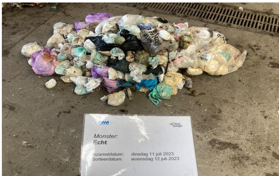
Luiers in Echt