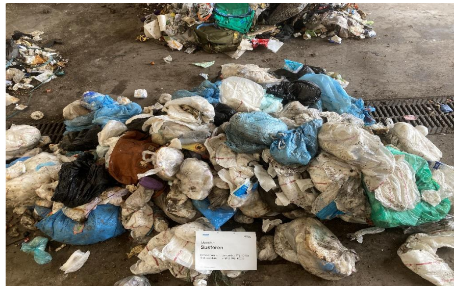
Luiers in Susteren