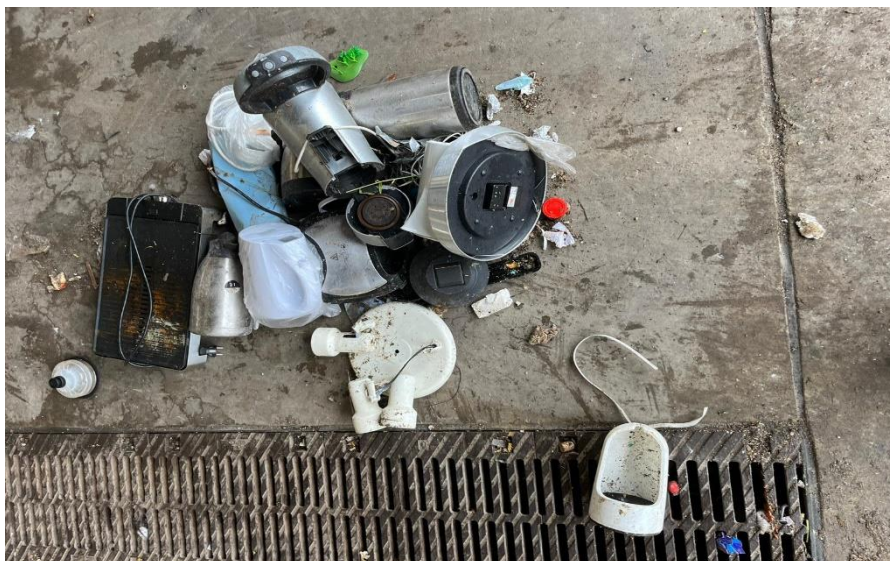
Elektrische apparaten in Maria-Hoop