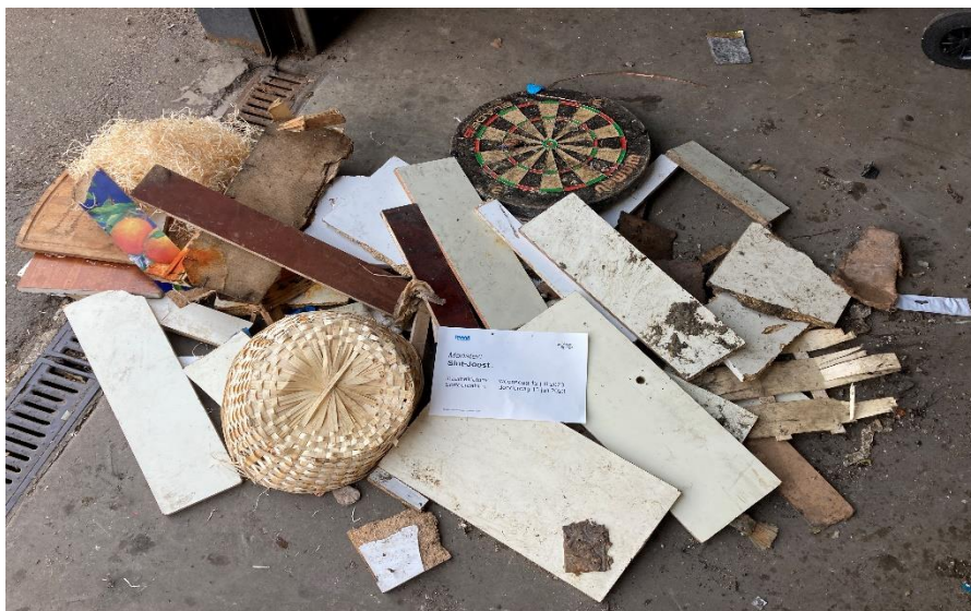
Hout in St. Joost