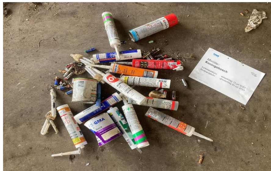
KCA in Koningsbosch