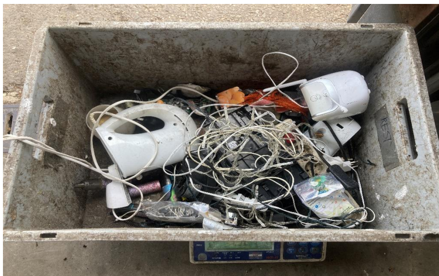
Elektrische apparaten in Nieuwstadt